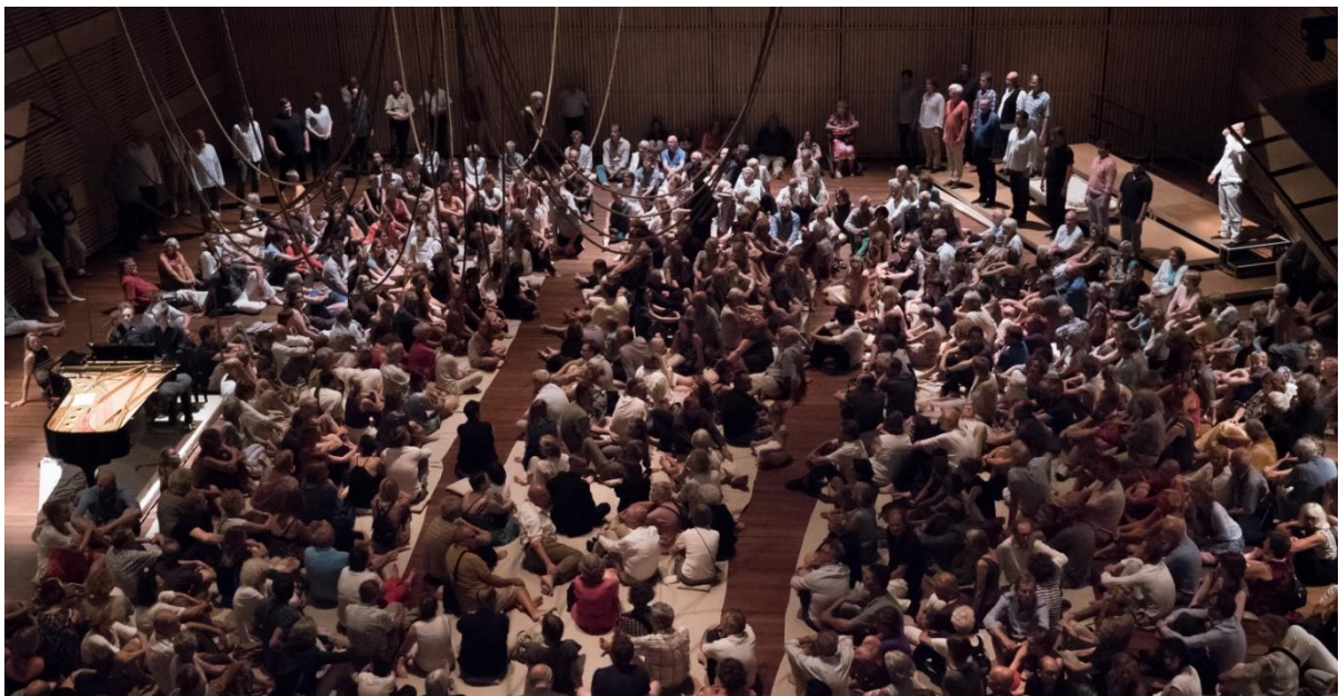
human requiem (Koorbiënnale 2015)

De komende festivals zetten we in op een flinke versterking van ons internationale profiel. We treden daartoe op als initiator of coproducent van internationale projecten en als curator van koormuziek uit diverse culturele tradities.