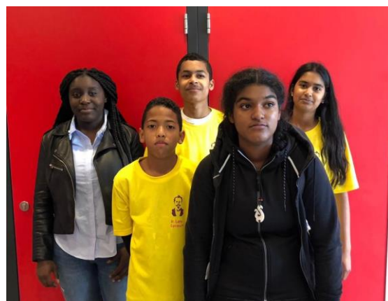
Leden van Ir. Lely Lyceum "Go Green" projectgroep

The PROTEST and the PROPHECY zal zowel buiten als binnen opgevoerd worden. The PROTEST omvat een korte reeks luidruchtige marsliederen voor het Extinction Rebellion Koor (een jongerenkoor van Ir. Lely Lyceum leerlingen), blazers en slagwerkers en wordt uitgevoerd op straat. The PROPHECY , voor beroepskoor en cellist, verklankt teksten van Emerson en leidt tot verstilling en reflectie. Dit deel wordt binnen uitgevoerd. Werk-in uitvoering met partner Ir. Lely Lyceum.