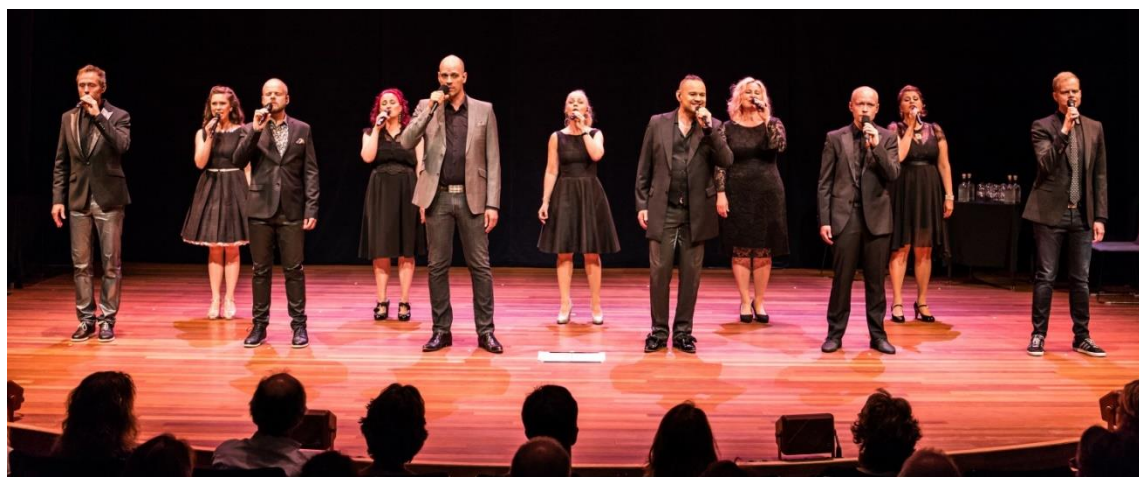
Level Eleven concert en masterclass i.s.m. BALK (2017)

Samen met landelijke instellingen BALK (de Nederlandse vereniging voor pop- en lichtmuziek koren), het Nederlands Koorfestival, LKCA en Koornetwerk Nederland biedt de Koorbiënnale een evenement waarop de pracht en praal van koorzingend Nederland gevierd wordt. Concerten van de beste amateurkoren en ensembles, workshops, een focus op niet-Westerse tradities, inspiratiesessies en een keynote speaker brengen “the best of what we have” voor één dag in een onvergetelijke zangbeurs samen. The BIG SING eindigt met precies dat: een instant scratch performance voor massakoer waarin alle deelnemers samen het dak van de Philharmonie wegblazen.