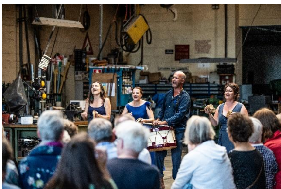
Chet Nuneta Korennacht

In deze nachtelijke fietstocht naar geheime locaties komen 4 pelotons steeds onbekende musici en culturen tegen; ze trekken letterlijk en figuurlijk met een muzikaal paspoort door de eigen stad. Na korte optredens van een kwartier fietst men door naar de volgende locatie. Het slotconcert rond middernacht wordt door alle 280 fietsers bijgewoond en brengt dit multiculturele feest tot een daverende slot.