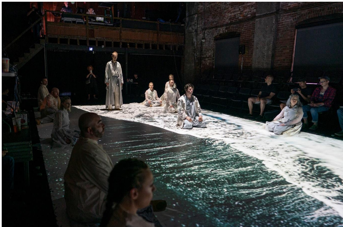
The Crossing | Kloccriketeater | ANIARA (Festival 2019)