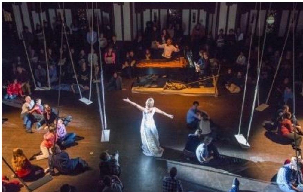
Rundfunkchor Berlin: “human requiem” in reprise plus workshop programma 2023

We halen deze baanbrekende encenering van de Brahms' klassieker terug, dé hit van Koorbiënnale 2015. De productie reist nog steeds de wereld rond en heeft geen fractie aan impact verloren. We bieden het publiek dat in 2015 de voorstelling moest missen, graag alsnog de kans dit unieke project van menselijkheid en troost te beleven. Gemikt wordt op 6 uitvoeringen met een totale capaciteit van 3000 kaarten. Koorleden geven ook workshops over de “immersive” presentatievorm.