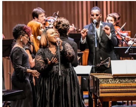
Holland Baroque | London Community Gospel Choir | Gospel Baroque (Koorbiënnale 2019)

Qua uitstraling hebben we ons nationaal met een impact geprofileerd die in 2001 ondenkbaar was. Koorbiënnale manifesteerde zich als pluriform koormuziekfestival dat excellentie naast het wilde enthousiasme van de liefhebber en prangende maatschappelijke kwesties plaatst.