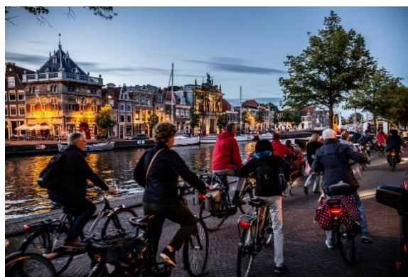
Korennacht: Paspoort in Eigen Stad