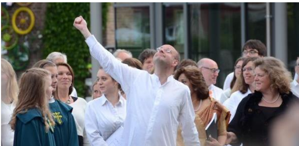
Slotscène "The Veil of the Temple" van Sir John Tavener: LUDWIG, Cappella Amsterdam, Nederlands Kamerkoor

Dit nachtelijk, 9 uur durende geestverruimende werk gooide hoge ogen bij zijn première en zal met trots opgevoerd worden als onderdeel van de festivalopening. Veil of the Temple omspannt diverse culturen, zowel Westers als niet-Westers waarin een solo alt, drie koren, orgel, slagwerk, blaasensemble en kinderkoor de ruimte volledig in beslag nemen. Het publiek wordt meegesleept in een hedendaags collectief ritueel. Pas bij zonsopgang, wanneer het publiek in één stoet naar buiten gaat, eindigt de voorstelling in de buitenlucht.