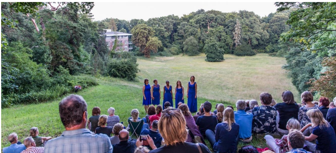
Wishful Singing – woodbirds (Koorbiënnale 2017)

In 2017 zetten we deze "learning" voort: Onder het motto 'Bos-Stad-Metropool' speelde het festival met locaties, betrok het andere kunstvormen (ballroom dancing, moderne dans, film), zette het publiek een spetterende avond voor met popmuziek en swing op hoog niveau en betrok het metropoolpubliek ( Anthracite Fields van Julia Wolfe met Bang-on-a-Can uit New York). Er was oude muziek (Huelgas Ensemble), nieuwe muziek (Wolfe, David Lang), een staalkaart van noordelijke composities (Lets Radiokoor) naast de ongepolijste herdersmuziek van het Sardijnse Tenore Monte Arvu en traditionals als het Festivalkoor met de gebroeders Jussen in een klinkende Carmina Burana . De nieuwe generatie koorzangers meldde zich, van Damask Vocal Quartet tot het Nationaal Gemengd Jeugdkoor. VOCES8 maakte zijn debuut. Er was meer publiek dan ooit.